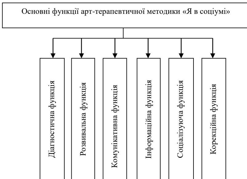
Рис. 1 Функціональні можливості арт-терапевтичної методики «Я в соціумі»

Виходячи із функціонального потенціалу даної методики, можна очікувати наступні результати: виявлення та усвідомлення особистістю сформованих у неї патернів поведінки у соціальних групах; усвідомлення місця, яке особистість дозволяє собі займати у соціальних групах та з'ясування на скільки така ситуація її задовольняє; усвідомлення власної позиції: лідер чи той, кого ведуть за собою; усвідомлення ефективності сформованих патернів поведінки; визначення кордонів особистості, її бажання та можливостей їх розширювати та захищати; визначення комфортних меж взаємодії з іншими людьми; виявлення способів взаємодії у соціальній групі; отримання досвіду діяти новими для особистості способами; розширення навиків відстоювати свої позиції та кордони у групі; здобуття позитивного досвіду соціальної взаємодії на прикладі інших учасників групи; об'єктивне бачення реакції інших людей на власні дії; визначення ефективності групової роботи та